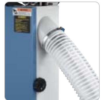
Für eine optimale Späneabfuhr ist die Maschine mit zwei Absaugstutzen 100 mm ausgestattet