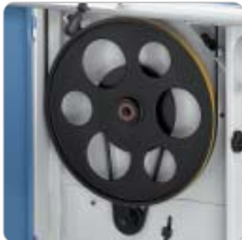
Die gewünschte Schnittgeschwindigkeit wird über einen Keilriemen am unterem Laufrad eingestellt