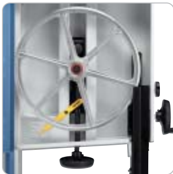
Die Einstellung der Blattspannung erfolgt mittels Handrad und wird über ein Diagramm am oberen Lauf rad angezeigt

Schnitt Höhenverstellung mittels Handrad über eine Zahnstange mit mm-Skala Verwindungsfreier Maschinenkörper garantiert einen ruhigen und präzisen Lauf Schwungräder aus Alu-Druckguss mit Spezialgummibandage für eine lange Lebensdauer der Sägebänder Großdimensionierter Säge Tisch aus Grauguss, schwenkbar von -10^{\circ} bis +45^{\circ} Serienmäßig mit zwei Absaugstutzen (100 mm) für eine optimale Späneabsaugung Leicht verschiebbarer Parallelanschlag aus Aluminium mit Schnellklemmsystem und integrierter Lupe Serienmäßig mit zwei Geschwindigkeiten zur Anpassung der Schnittgeschwindigkeit an das jeweilige Material Sichtfenster an der Front zur Überprüfung des Sägebandlaufs