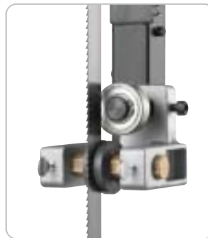
Die wartungsfreie Präzisionsrollenführung ober- und unterhalb des Säge tisches sorgt für eine optimale Führung des Sägebandes