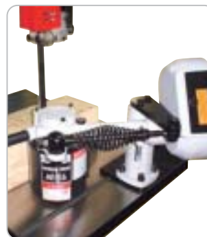
Optional lieferbar: CO-MATIC Bandsägevorschub