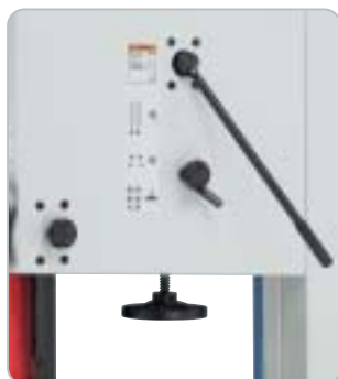
Einfacher Sägebandwechsel mit Schnellspannhebel, die Grundeinstellung des Antriebsrades wird dabei nicht verändert