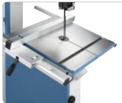
Großdimensionierter Säge Tisch mit geschliffener Oberfläche und T-Nut für den Gehrungsanschlag (Standard)