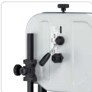
Benutzerfreundliches Sägeband-Wechselsystem mit integrierter Bandspannungsanzeige