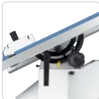
Die robuste Schwenkeinrichtung ermöglicht Winkelschnitte von -10^{\circ} bis +45^{\circ}