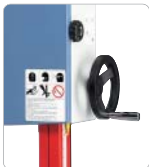
Präzise Höheneinstellung der Schnitthöhe mittels Handrad an der Stirnseite

Schwere geschlossene Bauform garantiert vibrationsfreien Lauf Massiver Graugusstisch, durch die große Auflagefläche wird ein sicheres Arbeiten gewährleistet Robuste Schwenkeinrichtung aus Grauguss, benutzerfreundliche Gradeinstellung mittels Handrad Leistungsstarker Antriebsmotor gewährleistet auch bei Dauerbetrieb eine optimale Schnittleistung Kugelgelagerte Präzisionsführung über und unter dem Maschinentisch Abweichfrei geführter Längsanschlag aus Grauguss, abnehmbar in jeder Position Dynamisch ausgewuchtete Laufrollen aus Grauguss sorgen für einen ruhigen Lauf Schnitthöhenverstellung mittels Handrad über eine Zahnstange mit mm-Skala