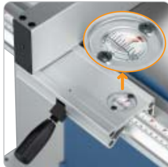
Der leicht verstellbare Aluminium-Längsanschlag wird mittels Schnellklemmung mühelos an der gewünschten Position fixiert. Ablesung der mm-Skala mittels Lupe