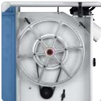
Die gewünschte Schnittgeschwindigkeit wird über einen Keilriemen am unterem Lauf rad eingestellt