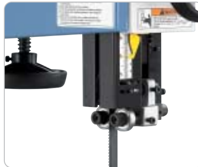
Kugelgelagerte Präzisionsführung über und unter dem Säge Tisch sorgen für die perfekte Bandsägeblattführung