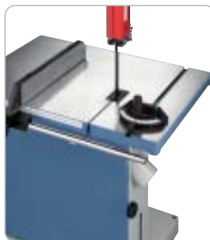
Großdimensionierter Säge Tisch mit geschliffener Oberfläche und T-Nut für den Gehrungsanschlag (Standard)