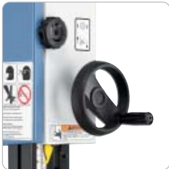
Mittels Handrad und Zahnstange kann die gewünschte Schnitthöhe schnell und einfach eingestellt werden. Ablesung über eine mm-Skala

Serienmäßig mit Präzisionsrollenführung über und unter dem Tisch Einstellung der gewünschten Schnitthöhe erfolgt über ein Handrad und ist mittels mm-Skala ablesbar Sichtfenster mit Anzeige der Blattspannung für die jeweilige Sägebandbreite Dynamisch ausgewuchtete Laufräder aus Grauguss sorgen für einen ruhigen Lauf Einfacher Sägebandwechsel mit Schnellspannhebel, die Grundeinstellung des Antriebsrades wird dabei nicht verändert Automatische Abschaltung beim Öffnen des Maschinengehäuses Schnittgeschwindigkeit mittels Keilriemen auf das jeweilige Werkstück einstellbar (2 Stufen)