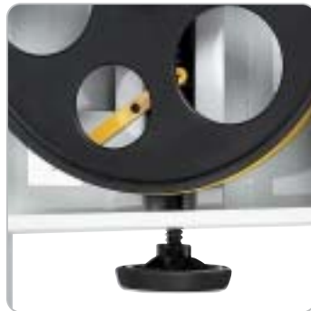
Die Einstellung der Blattspannung erfolgt mittels Handrad und wird über ein Diagramm am oberen Laufrad angezeigt