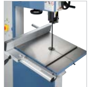
Großdimensionierter Säge Tisch mit geschliffener Oberfläche und T-Nut für den Gehrungsanschlag (Standard)