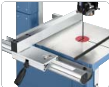
Leicht einstellbarer Aluminium-Längsanschlag mit Schnellklemmung, mm-Skala mittels Lupe ablesbar

Einstellung der Schnitthöhe erfolgt mittels Drehknopf und Zahnstange mit mm-Skala Die Kraftübertragung erfolgt über einen Poly-V-Riemenantrieb Verwindungssteife, stabile Stahlblechkonstruktion für einen vibrationsfreien Lauf Serienmäßig mit integrierter Absaugeinrichtung und Spänesack ausgestattet (S 350 H) Lange Lebensdauer der Sägebänder durch Schwungräder aus Alu-Druckguss mit Spezialgummibandagen Obere und untere Präzisionsrollenführung (S 350 P) Großdimensionierter Graugussstisch mit geschliffener Oberfläche, schwenkbar von -10^{\circ} bis +45^{\circ} Serienmäßig mit Gehrungsanschlag, leichtgängigem Aluminium-Längsanschlag, Schnellklemmung und Lupe Inklusive Endschalter für automatisches Abschalten beim Öffnen des Maschinendeckels