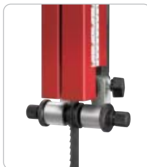
Die Präzisionsägebandführung über und unter dem Säge Tisch sorgt für einen perfekten Lauf des Sägebandes und gewährleistet dadurch beste Schnittergebnisse