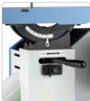
Der Säge Tisch wird mittels Spannhebel an der gewünschten Gradstellung geklemmt