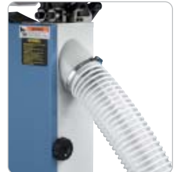
Für eine optimale Späneabfuhr ist die Maschine mit 2 Absaugstutzen 100 mm ausgestattet