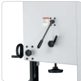
Einfacher Sägebandwechsel mit Schnellspannhebel, die Grundeinstellung des Antriebsrades wird dabei nicht verändert