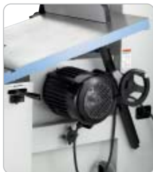
Benutzerfreundliche, patentierte Tischschwenkung mittels Handrad, der Säge Tisch wird mit einer Zahnstange zusätzlich gestützt